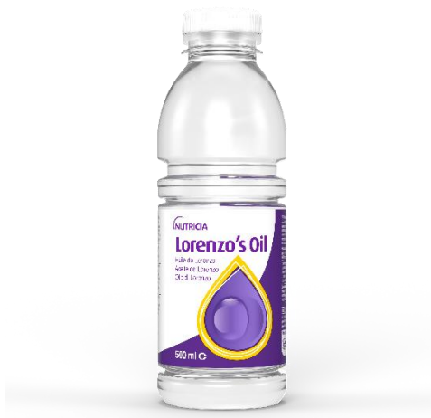
Obrázok 2: Zobrazenie DP LORENZO-OIL